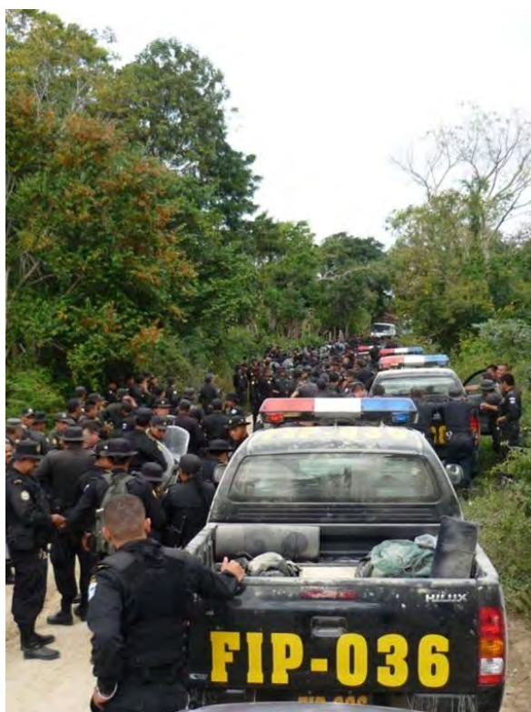
Operativo de alto impacto en la RBM